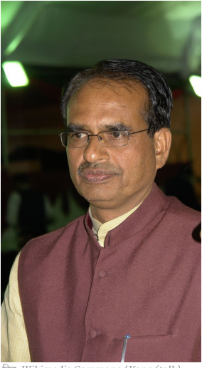
चित्र: Wikimedia Commons / Yann (talk)