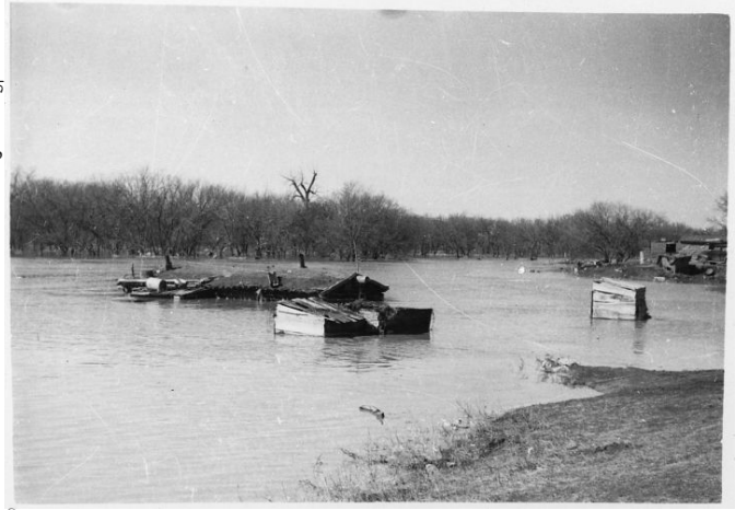
चित्र: Wikimedia Commons / Unknown authorUnknown author or not provided