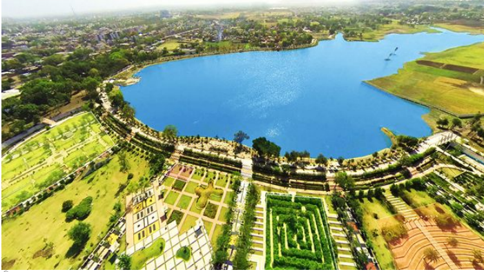
चित्र: Wikimedia Commons / 1. Central Indore Skyline - John Hoey (Flickr) 2.

इंदौर शहर पिछले पांच वर्षों से एक नए मास्टर प्लान के अभाव का सामना कर रहा है, जिसके कारण अव्यवस्थित विकास और अनियोजित बस्तियों में वृद्धि हुई है। शहर की योजना बनाने की प्रक्रिया में यह विलंब महत्वपूर्ण चिंता का विषय बन गया है। बता दें कि वर्तमान मास्टर प्लान की मियाद पांच साल पहले ही समाप्त हो चुकी है। इसके बाद से शहर के विकास को दिशा देने वाली कोई नई विस्तृत योजना लागू नहीं हो सकी है। आधिकारिक सूत्रों के अनुसार, नया मास्टर प्लान अब 'मेट्रोपॉलिटन सिटी' के रूप में अधिसूचना जारी होने के बाद ही तैयार किया जाएगा। इस नई योजना में वर्ष 2035 तक के विकास लक्ष्यों को ध्यान में रखा जाएगा, ताकि इंदौर का भविष्य में सुनियोजित विकास सुनिश्चित हो सके।